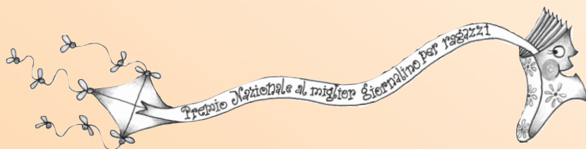
Illustrazione di Lucrezia Giarratana

L'Associazione Ligure Letteratura Giovanile (ALLG) , nata nel 2003, promuove iniziative, studi e ricerche su libro e lettura nella prospettiva della formazione integrale della persona, con particolare attenzione all'intreccio dei diversi linguaggi della comunicazione, tipici dell'attuale scenario culturale. Organizza dal 2005 il Premio nazionale "Città di Chiavari" al miglior giornalino per ragazzi.