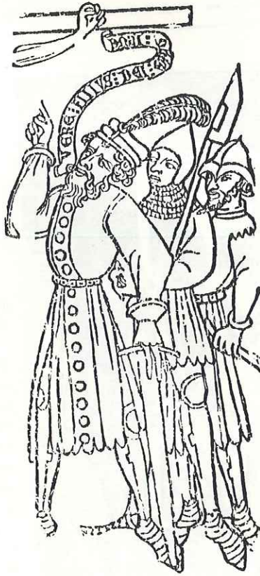
Le Bois Protat (vers 1380). Fragment d'un bois gravé, retrouvé au XIX e siècle, sans doute destiné à décorer une nappe d'autel.